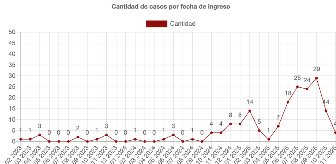
Gráfica 1. Comportamiento temporal de las acciones de tutela identificadas en el sistema Pretoria (2023–2025)